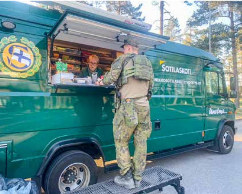
Sotilaskotiauto Unelma maastokeikalla.

sotilaskodin voimin. Vanhin paikallisosastomme Hangossa täytti 100 vuotta lokakuussa. Muuttuneessa toimintaympäristössä on aina löytynyt keinot tukea varusmiesten hyvinvointia ja edistää myönteistä maanpuolustushenkeä.