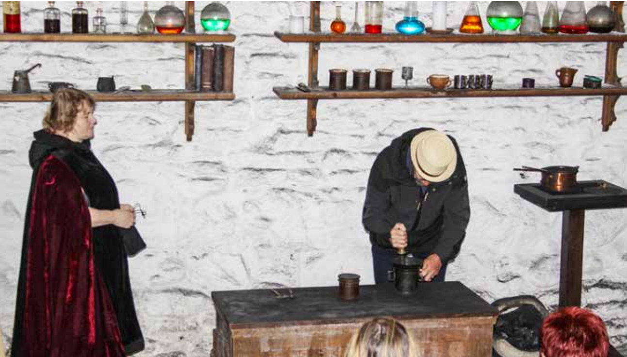
Ruudin valmistusta Rakveren linnassa.