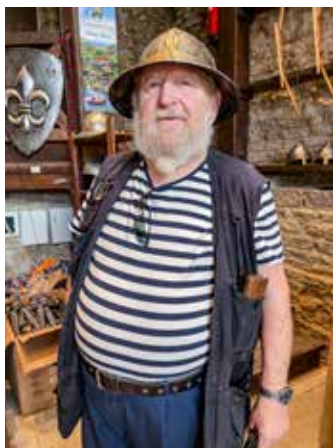
"Rakveren linnan vartiomies".

ei ole tehty vaan usein ollaan ensin "pistetty pakettiin" ja vasta sitten mietitty mitä voisi tulla tilalle. Kiitos vielä järjestäjille mukavasta tapahtumasta, oli mukava tavata vanhoja tuttuja eri puolilta rannikkoa. Odotamme innolla ensi vuoden seminaaria/ seminaareja.