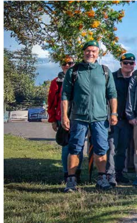
Kaksi Jurmollista Öron retkeläisiä.

Kyllä retkipäiväkirjaan voi laittaa merkinnän, ”täys meripäivä”.