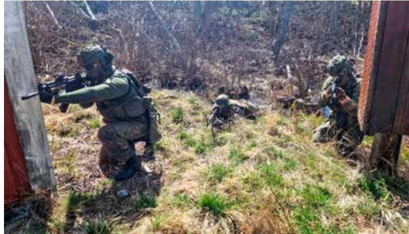
Kouluttajakoulutuksen rasti – Kouluttajakoulutuksen oheisharjoittelua.

Uutuutena kevään kurssin yhteydessä järjestettiin ensimmäinen sukeltajille kohdennettu MPK:n kouluttajakurssi. Kurssilla oli mukana 5 kurssilaista ja kaksi Killan omaa kouluttajien kouluttajaa. Kurssi käynnistyi torstaina Upinniemen varusvarastolla jatkuen teoriaosiolla Hangoskurssilaisten odottaessa saa-