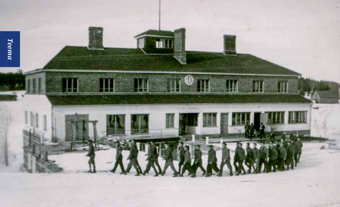
Sotilaita esikunnan pihalla kevättalvella 1941.