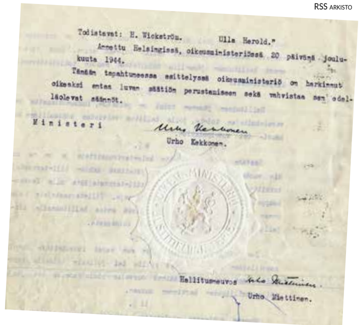
Säätiö hyväksyttiin säätiörekisteriin 20.12.1944. Asiakirjan allekirjoitti tuolloinen oikeusministeri Urho Kekkonen.