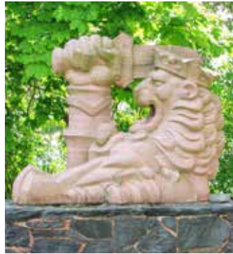
Leijonapatsas Merisotakoulun pihassa.

Apulaisiksi kiven hakkaamiseen oli valittu neljä korpraalia. Kivet haettiin Soksusta proomulla. Niiden siirtäminen oli