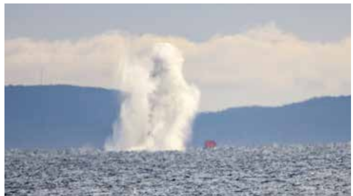
Huomio – iskee.