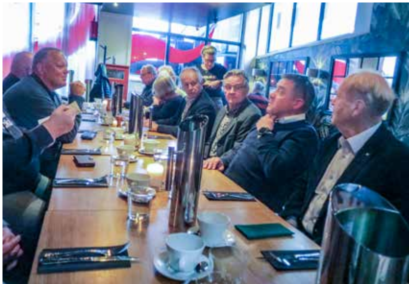
Seminaarin paluumatkalla ruokailu Porvoossa.

laan hankkimassa uusia suorituskypyjä ennen kuin vanhoista kokonaan luovutaan. Aina näin