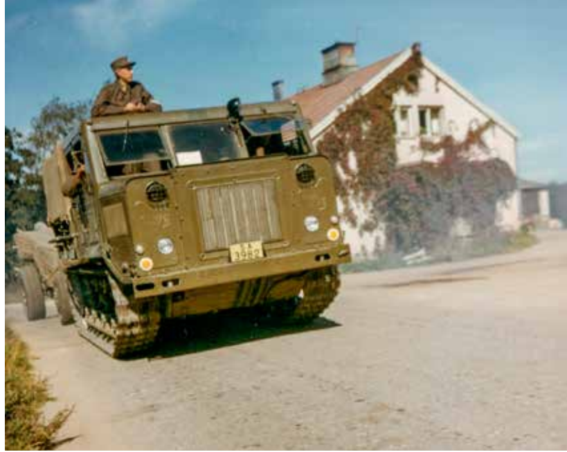
Korppoon teillä on kulkenut monenlaista menijää, myös tehokkaampia kuin yhdellä hevosvoimalla kulkevia. Kuvassa AT-S telavetäjä Korppoossa vuonna 1967.

Olin vähän lihonut. Käytin sitä tekosyynä, miksi kävin ratsastamassa lounaan sijasta. Siihen aikaan pukeuduin M36. Helputukseksi sai aukaista kauluksen hakaset ja vyötä ei tarvinnut käyttää. Kappi-saappaat olivat mittojen mukaan teetetyt. Olen aina ihmetellyt, miksi suutari otti mitat Teräksellä rautakaupassa. Oli talvi, joten käytin turkislakkia. Vanhat lotat puhuivat: tuo meidän kapteenimme on kuin Mannerheim kun hän tuolla ratsastaa. Patteriston komentaja, majuri, lähti taisteluväline-