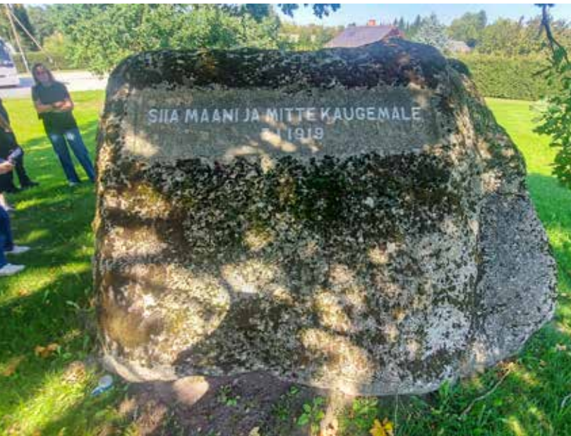
Valklan kivi: ”Tähän asti vaan ei edemmäksi”.

K un tämä lehti ilmestyy, ollaan lähellä joulua ja on aika rauhoittua joulun viettoon. Joulupukkia odotellessa voi hyvin vielä muistella syksyn toimintaa. Normaalien rutiiniasioiden lisäksi retkeiltiin Virossa, muisteltiin rannikkotykistön historiaa ja osallistuttiin vielä ”Suomen rannikkotykistö sodissa 1939-1945” -näyttelyn purkuun. Hallitus kartoitti myös alustavasti vuoden 2025 toimintaa. Päätökset tehdään sitten vuosikokouksessa, joka perinteiden mukaisesti järjestettävien maaliskuun alkupuolella.