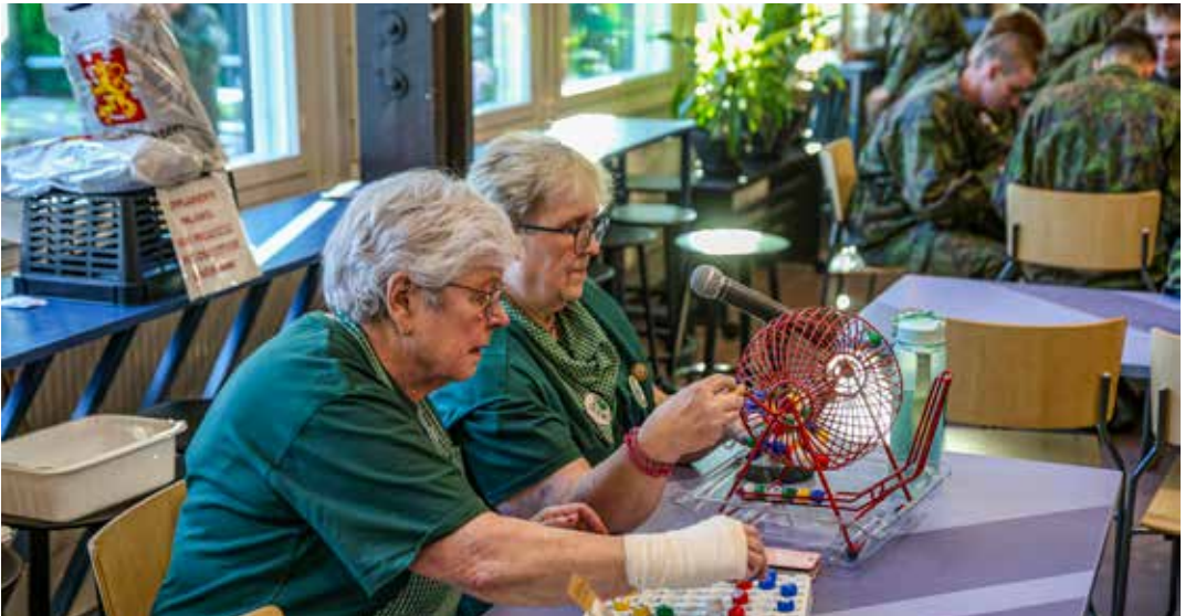
Sotilaskotisarten järjestämien teemailtojen suosikkipeli on Bingo.