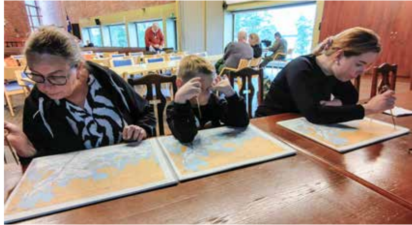
Kolme sukupolvea karttatehtävän ääressä.

Kurssista tehdyn palautekyselyn arvosana 4,78/ 5,0 kertoo tapahtuman onnistumisesta. Vapaan palautteen maininnat ”Huikea jengi ja ilmapiiiri! Todella selkeää ja kivaa”, ”Positiivinen opettava asenne kouluttajilla” ja ”Tapahtumassa oli mukava ja ystävällinen tunnelma, rasteilla huomioitiin lapset hyvin.”.