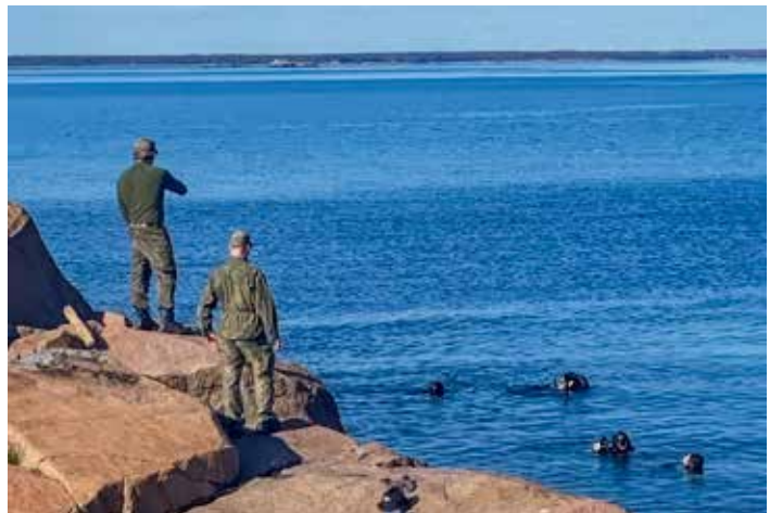
Kouluttajakoulutuksen rasti – Pelastusharjoitus rannassa.

Killan toiminnassa on tällä hetkellä käynnissä aktiivinen koulutustoiminnan uudistaminen. Olemme kouluttaneet uu-