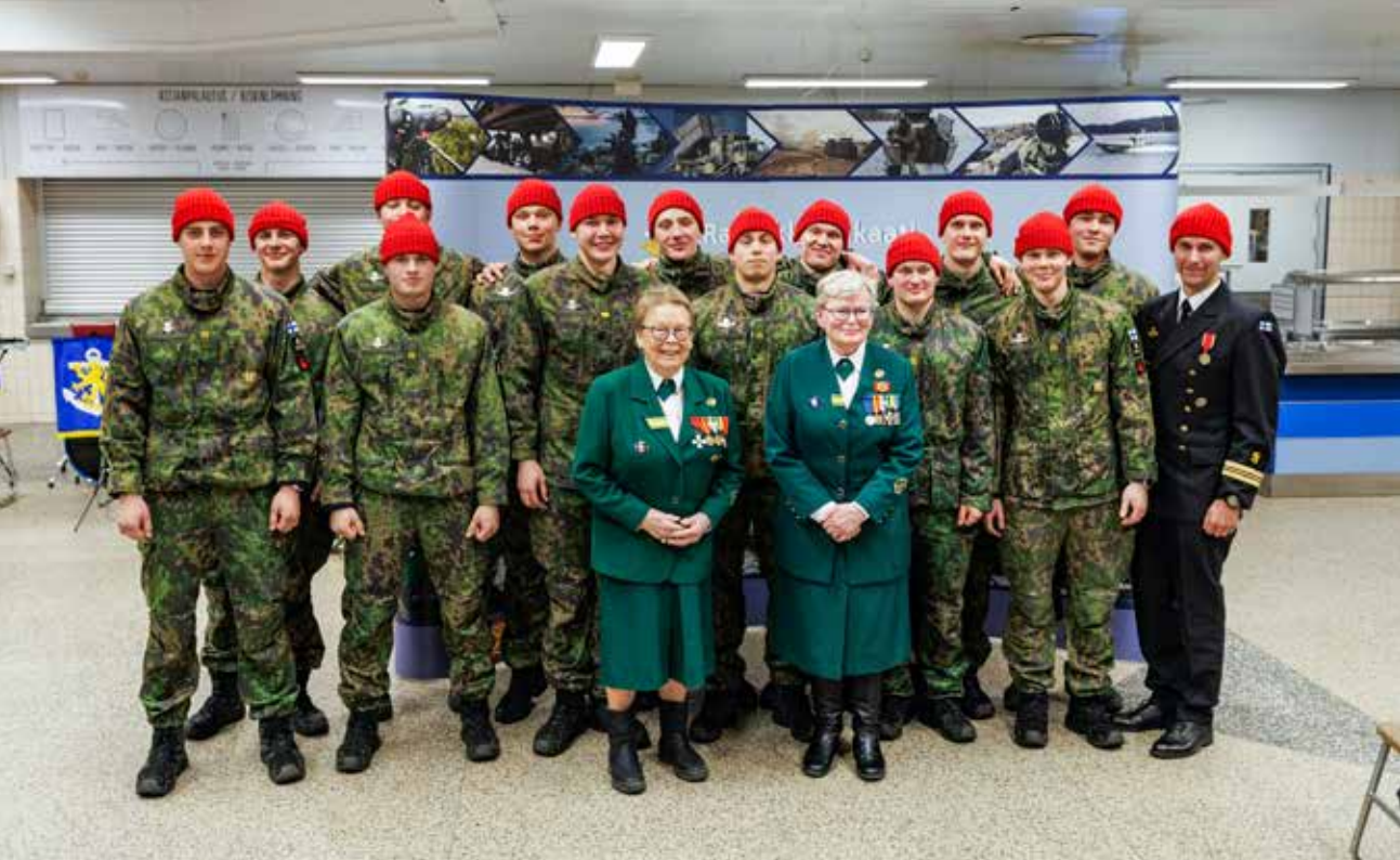
Sukeltajakurssi sai joulukuussa 2023 säätiön juhluvuoden ennakkona punaiset pipot.